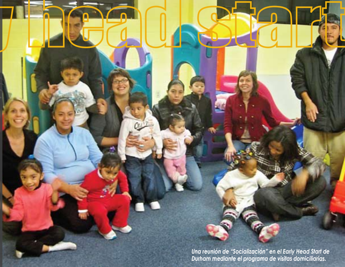
Una reunión de "Socialización" en el Early Head Start de Durham mediante el programa de visitas domiciliarias.