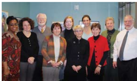
Los miembros del Comité de planificación se reunieron regularmente para iniciar la puesta en práctica del programa. El equipo fue compuesto de una persona encargada de planificar el inicio de EHS así como de miembros del personal de La Asociación para los Niños de Durham, CHTOP y HFD.

(CHTOP, por sus siglas en inglés) es la "agencia contratada" que realiza las operaciones de cada día del programa EHS de Durham. CHTOP ha estado administrando el programa de EHS del Condado de Orange desde el año 1998.